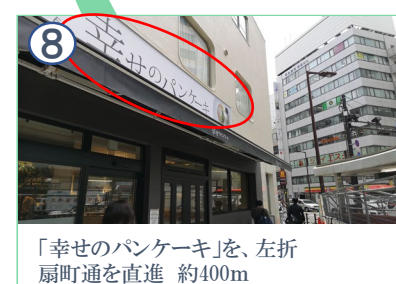
「幸せのパンケーキ」を、左折扇町通を直進 約400m