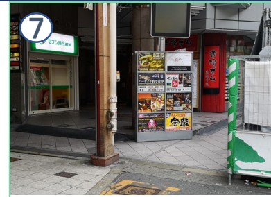
渡り切ったすぐを、右折