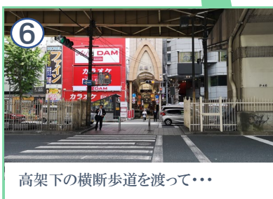
高架下の横断歩道を渡って...