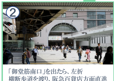
「御堂筋南口」を出たら、左折横断歩道を渡り、阪急百貨店方面直進

所要時間：約15分 距離：約950m セミナーハウス クロス・ウェーブ梅田 〒530-0026 大阪府大阪市北区神山町1-12 TEL 06-6312-3200