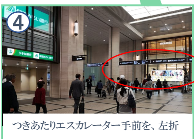
つきあたりエスカレーター手前を、左折