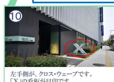
左手側が、クロス・ウェーブです。「X」の看板が目印です。