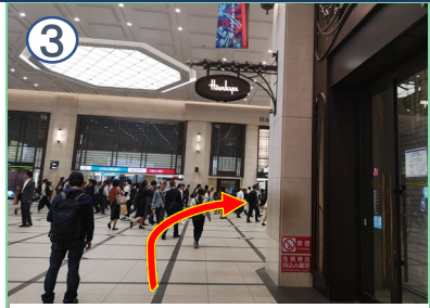
正面に三井住友信託銀行などが見える阪急百貨店沿いを、右折