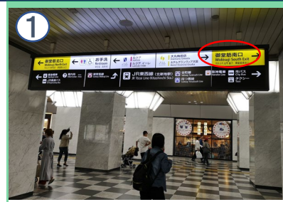
改札「御堂筋口」を出て、右折「御堂筋南口」から外へ