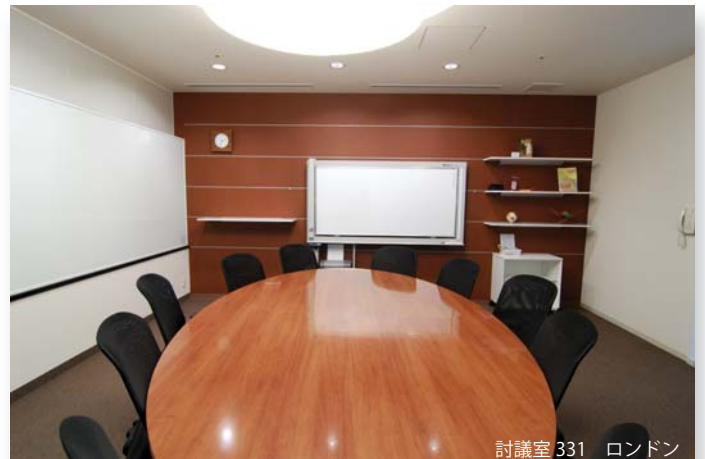
討議室 331 ロンドン