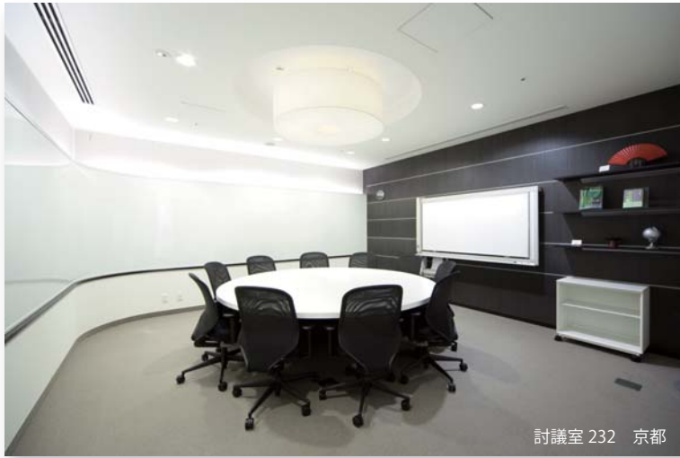
討議室 232 京都