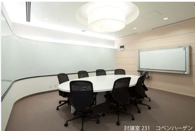
討議室 231 コペンハーゲン