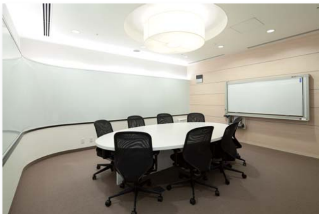
討議室 231 デザインコンセプト「コペンハーゲン」